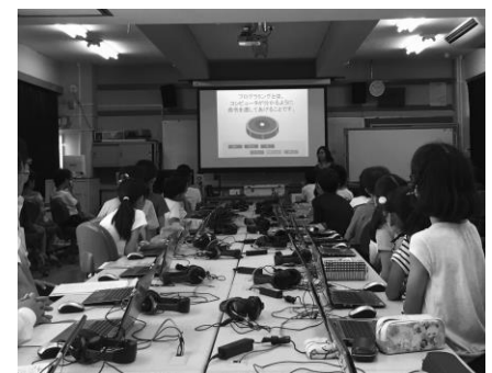
柏市でのプログラミング教育の授業の様子